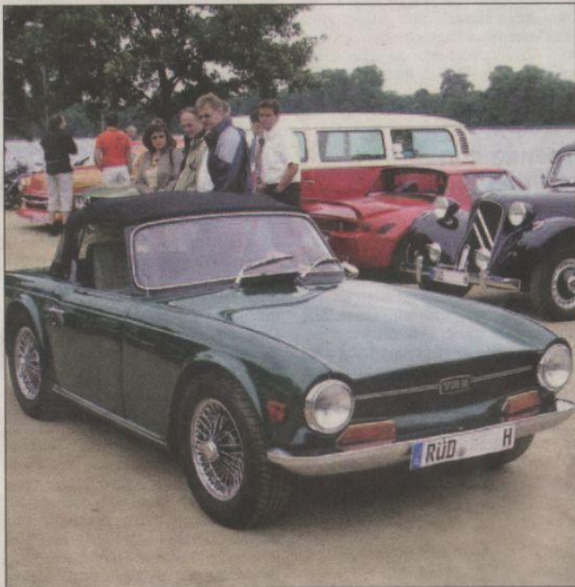
Eltville, am Rheinufer.